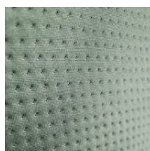
Cactus - RAL 1305010 Cactus - RAL 1305010