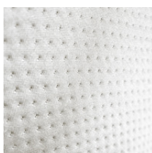
Perle - RAL 0858010 Pearl - RAL 0858010